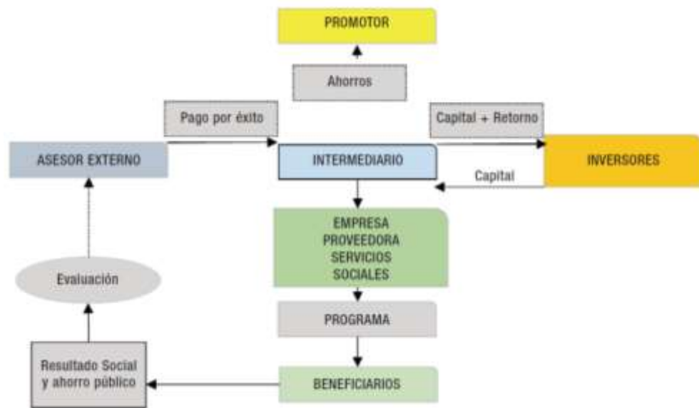
Figura 1: Estructura de un Bono de Impacto Social.

exactitud de las métricas utilizadas para medir, en términos financieros, el impacto social generado 1 (figura 1).