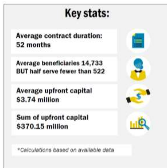
Figura 4: Datos sobre los Bonos de Impacto Social

Brookings Institution sobre la base de los datos disponibles ha calculado que la duración media de los contratos es de 52 meses, el número de beneficiarios supera los 14.000 individuos y la suma total de capitales es de más de 370 millones de dólares 9 .